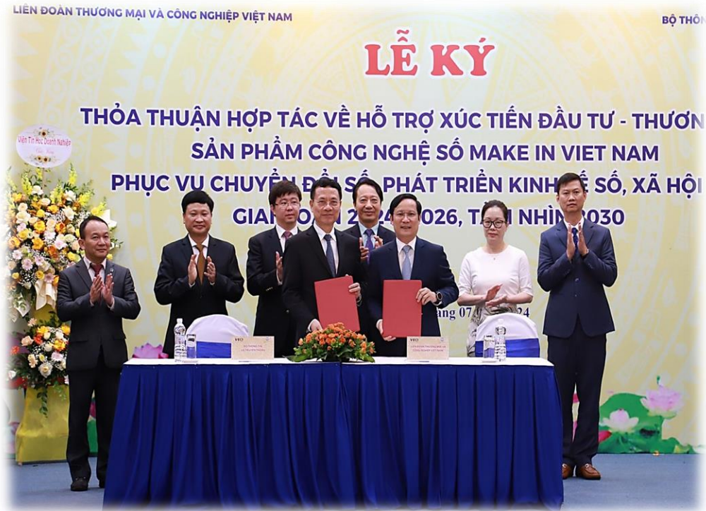
Lễ ký kết hợp tác giữa Bộ trưởng Bộ TT&TT Nguyễn Mạnh Hùng và Chủ tịch VCCI Phạm Tấn Công

dân tộc quan trọng cần thúc đẩy, hỗ trợ trong bối cảnh cả nước đang tiến hành công cuộc chuyển đổi số quốc gia, phát triển kinh tế số và xã hội số".