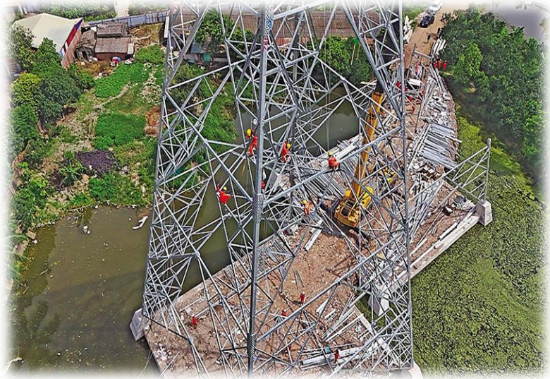
Doanh nghiệp nhà nước lo ngại xuất hiện thêm quy trình, thủ tục gây khó cho hoạt động. Trong ảnh: Thi công đường dây 500 kV mạch 3, đoạn Quảng Trạch - Phố Nối của EVN

Doanh nghiệp nào sẽ chịu sự điều chỉnh của Luật Quản lý và Đầu tư vốn nhà nước tại doanh nghiệp, ngoài doanh nghiệp 100% vốn nhà nước là đối tượng đương nhiên. Thế nào là vốn nhà nước, vốn của doanh nghiệp nhà nước và vốn của chủ sở hữu nhà nước đầu tư tại doanh nghiệp.